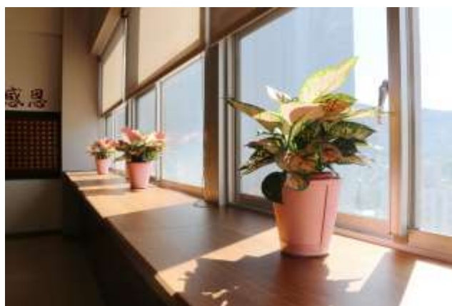
新增窗台邊桌，可一邊眺望美景一邊自習