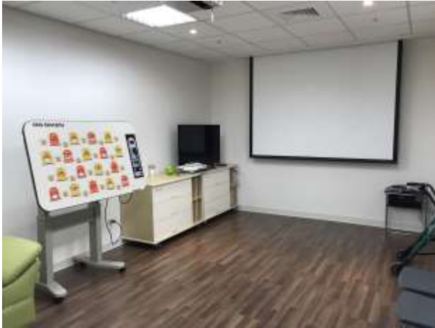
展齡服務暨研究中心

展齡服務暨研究中心係為提供長者在地共老場域，並整合學術研究及社區服務資源，以強化產學合作、執行產學研究計畫，透過服務及相關研究改善並提昇國內高齡照護品質，並備有老人生活自理輔具、飲食自理輔具、遊戲療法、音樂療法等輔具，提供教師教學使用。