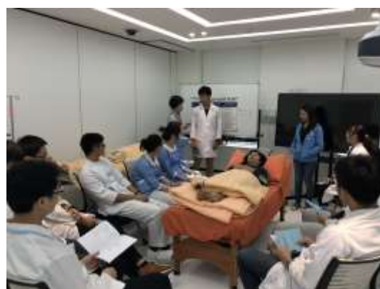
神經學檢查與評估