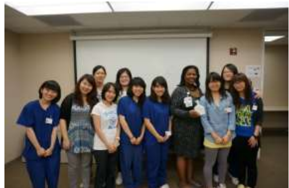
國際健康照護見習：開拓師生視野，提升競爭力