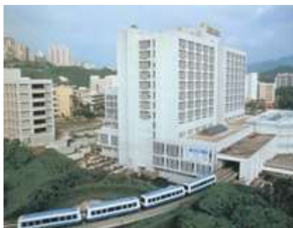
臺北市立萬芳醫院