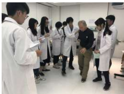
高齡者周全性健康評估

本學系與醫學系、呼吸治療學系、藥學系、醫學檢驗暨生物技術學系及通識教育中心進行跨學系整合性學習 GOSCE 課程，目前已有三門，包括高齡者周全性健康評估、預防老人吸入性肺炎、神經學檢查與評估。