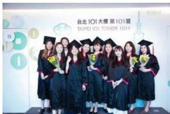
畢業典禮-101 巔峰之頂