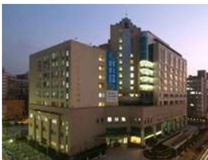
臺北醫學大學附設醫院