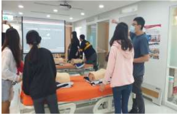
臨床護理專業技能選習

為增進護理學系畢業生畢業後適應瞬息萬變之職場環境，特開設大四學生進階臨床技能選習課程，以整合性教案為主軸，融入模擬護理之概念，以培育高年級學生整合學理與臨床技能之能力。