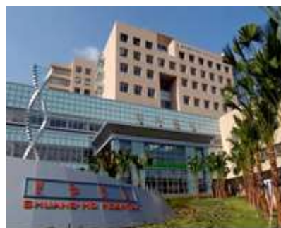
行政院衛生福利部雙和醫院