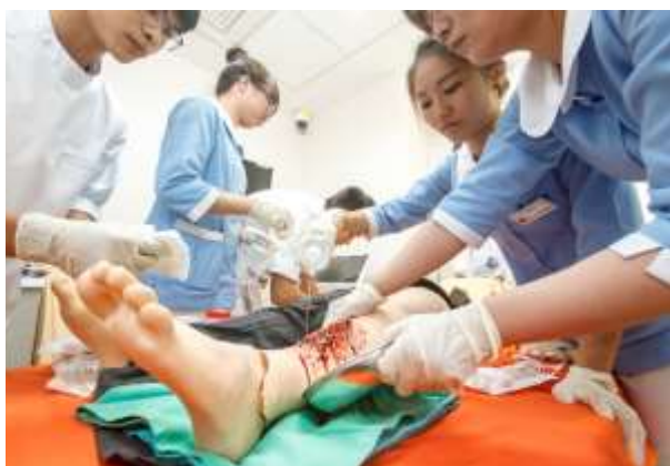
學生於示範病房進行護理技術操作

本示範病房為配合網際網路教學，採e化設計，增設液晶電視及大型投影螢幕，並搭配多媒體錄放影設備，以供上課師生使用。因應課程需求，備有各種模型及教具，包括：全人之人體解剖模型、心臟血流電氣模型、氣管模型、眼球模型、心臟模型、腦模型、腎臟模型、乳房模型、女性導尿模型、骨盆經線模型、妊娠體驗服、虛擬靜脈系統等，以協助各護理專業課程之進行。