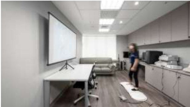
認知行為與健康促進實驗室

認知行為與健康促進實驗室 設有電磁波輻射針、半身式乳癌自我檢查模型、多媒體視窗版生理回饋組及附件、乾性生化分析儀、身體活動監測感應器轉接器與睡眠型態分析軟體等儀器設備； 生物行為實驗室 設有連續性動脈血壓測量儀、Biopac多功能心跳變易率分析系統、生物回饋設備系統與多媒體視窗版生理回饋組及附件等13件； 高齡暨慢性病運動實驗室 則設有脈博錶胸帶式發射器、無線心電圖監測系統、便攜式心肺功能測試系統與羅式愛固全脂血糖三用檢測儀等共16件。