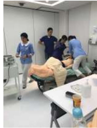
臨床護理專業技能選習 OSCE 考試