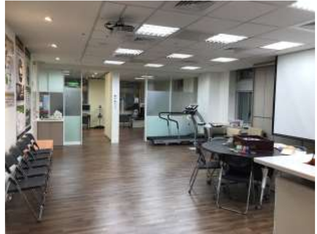
展齡服務暨研究中心