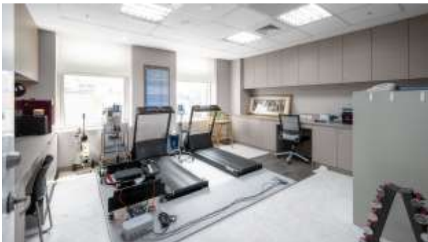
高齡暨慢性病運動實驗室