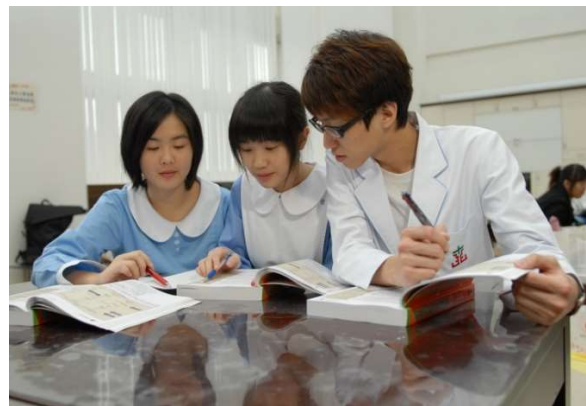
護理學院大廳提供師生進行討論