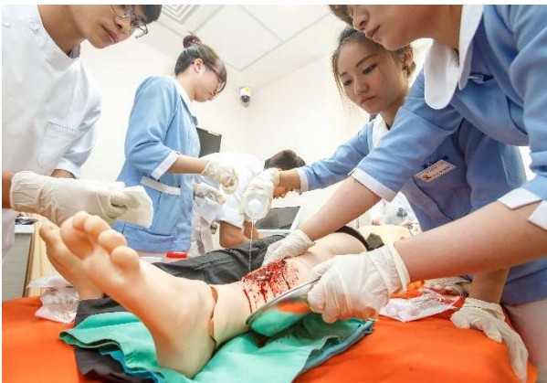
學生於示範病房進行護理技術操作

本示範病房為配合網際網路教學，採 e 化設計，增設液晶電視及大型投影螢幕，並搭配多媒體錄放影設備，以供上課師生使用。因應課程需求，備有各種模型及教具，包括：全人之人體解剖模型、心臟血流電氣模型、氣管模型、眼球模型、心臟模型、腦模型、腎臟模型、乳房模型、女性導尿管模型、骨盆經線模型、妊娠體驗服、虛擬靜脈系統等，以協助各護理專業課程之進行。示範病房聘任 1 名碩士級駐點教學助理，協助指導學生練習技術操作。