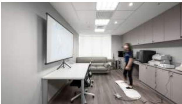
認知行為與健康促進實驗室

認知行為與健康促進實驗室設有電磁波輻射針、半身式乳癌自我檢查模型、多媒體視窗版生理回饋組及附件、乾性生化分析儀、身體活動監測感應器轉接器與睡眠型態分析軟體等儀器設備；生物行為實驗室設有連續性動脈血壓測量儀、Biopac 多功能心跳變易率分析系統、生物回饋設備系統與多媒體視窗版生理回饋組及附件等13件；高齡暨慢性病運動實驗室則設有脈博錶胸帶式發射器、無線心電圖監測系統、便攜式心肺功能測試系統與羅式愛固全脂血糖三用檢測儀等共16件。