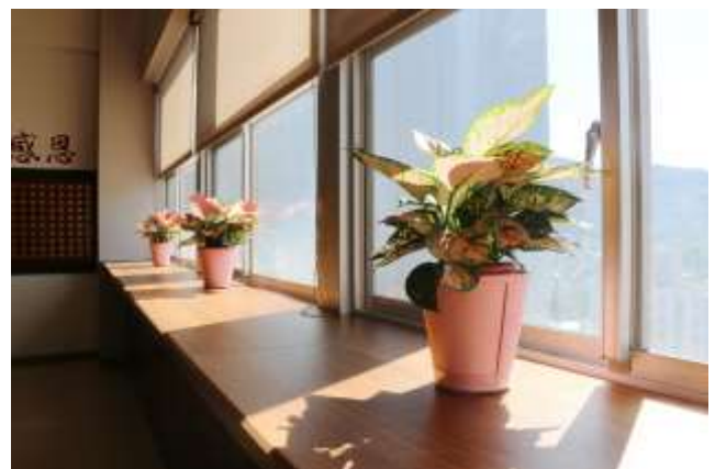
新增窗台邊桌，可一邊眺望美景一邊自習