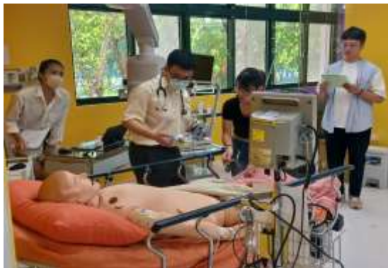
臨床護理專業技能選習

為增進護理學系畢業生畢業後適應瞬息萬變之職場環境，特開設大四學生進階臨床技能選習課程，以整合性教案為主軸，融入模擬護理之概念，以培育高年級學生整合學理與臨床技能之能力。