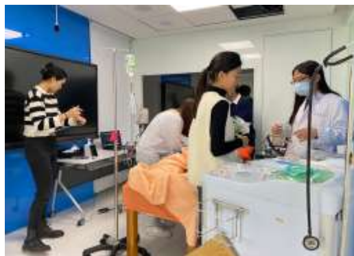
臨床護理專業技能選習 OSCE 考試