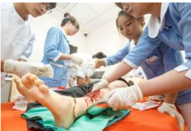
學生於示範病房進行護理技術操作

本示範病房為配合網際網路教學，採e化設計，增設液晶電視及大型投影螢幕，並搭配多媒體錄放影設備，以供上課師生使用。因應課程需求，備有各種模型及教具，包括：全人之人體解剖模型、心臟血流電氣模型、氣管模型、眼球模型、心臟模型、腦模型、腎臟模型、乳房模型、女性導尿模型、骨盆經線模型、妊娠體驗服、虛擬靜脈系統等，以協助各護理專業課程之進行。