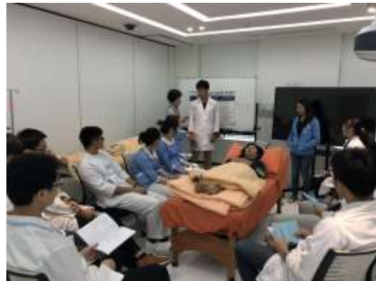
神經學檢查與評估