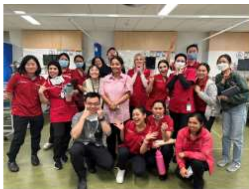
國際健康照護見習：開拓師生視野，提升競爭力